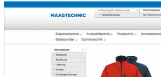
BOUTIQUE EN LIGNE

Tout internaute peut facilement se connecter à la boutique en ligne de Maagtechnic et faire son choix parmi les 45000 articles standard. La disponibilité et la date de livraison ainsi que les prix nets spécifiques aux clients sont indiqués en temps réel dans le panier. Vous pouvez également facilement télécharger les fiches produits et fiches de sécurité ou faire découper des produits semi-finis en matière plastique et élastomère à la taille désirée à l'aide du configurateur de coupe.