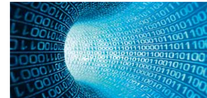
OCI & EDI

Le scanner manuel vous permet d'enregistrer des commandes et des aide-mémoires. Ils sont automatiquement transférés de votre ordinateur dans le panier Maagtechnic au moyen d'une interface. Les étiquettes à code-barres vous permettent de créer vous-même les articles et les gammes désirés. Vous vérifiez ensuite votre commande dans le panier Maagtechnic, puis la validez. Vous optimisez ainsi vos processus de commande et gérez vos marchandises de manière économique.