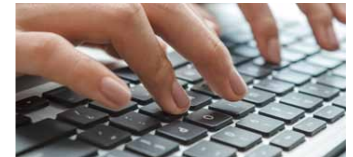
PLATES-FORMES & CATALOGUES ÉLECTRONIQUES

L'Open Catalog Interface (OCI) est une interface catalogue ouverte qui permet au système ERP du client de communiquer avec la boutique en ligne (catalogue de produits) de Maagtechnic. Vous avez le choix entre le catalogue standard et le catalogue spécial. Votre avantage réside d'une part dans la simplicité et la rapidité de l'interface et d'autre part dans le fait que vous n'avez plus à gérer des volumes importants de données concernant les produits des fournisseurs. Vous bénéficiez également des données sur les prix et le matériel en temps réel. Maagtechnic prend en charge la version 4.0 d'OCI ainsi que les versions précédentes.