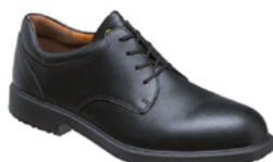
OFFICER 20 38 au 50