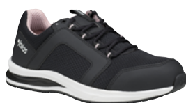
Tempus 5628 37 au 42