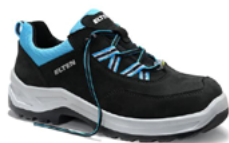
Lotte Aqua low 34 au 42