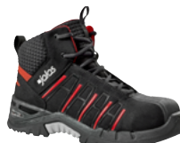
Exalter 9975 34 au 47