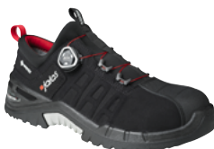
Exalter 9968 GTX 34 au 47