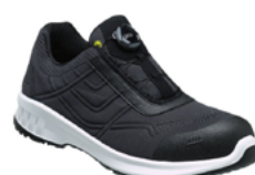
CP 4310 BOA 36 au 50