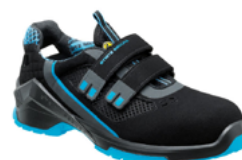
VD PRO 1000 VF 36 au 50