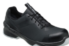
NORA 35 au 42