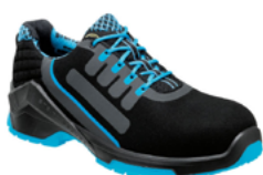
VD PRO 1500 ESD 36 au 50