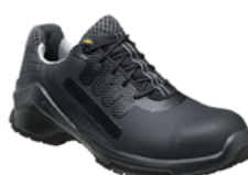
VD PRO 3500 SF 36 au 50