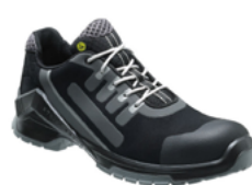
VD PRO 1510 ESD 36 au 50