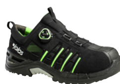
Exalter 9925 34 au 47