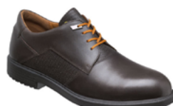
OFFICER 40 38 au 50