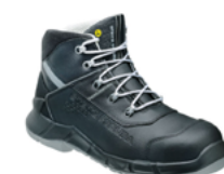
VX PRO 7750 ESD 36 au 50