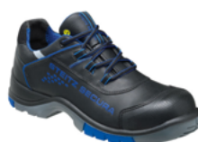
CK 7520 PERBUNAN SF 36 au 52