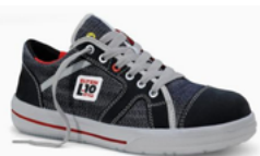
Elten Sensation low 37 au 48