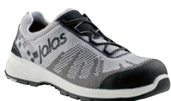
Zenit Evo 7128 35 au 48