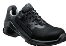
VD Pro 3500 GTX 36 au 48/49