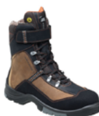
ESD CK POLAR SF ❄️ 38 au 47