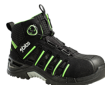
Exalter 9945 34 au 47