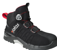
Exalter 9988 GTX 34 au 47