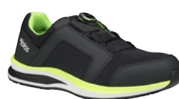
Tempus 5668 38 au 48