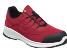
CP 4360 ESD 36 au 50