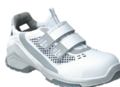
VD PRO 3070 ESD 36 au 50