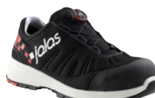
Zenit Evo 7138 35 au 48