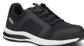
Tempus 5618 35 au 48